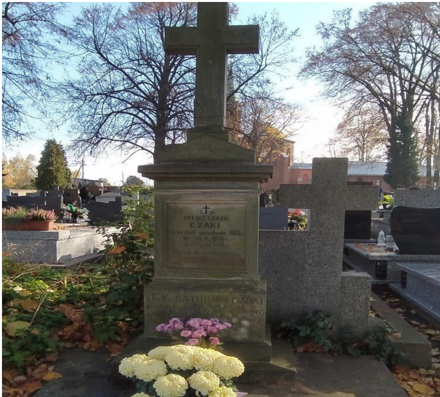
Mogiła Feliksa Erazma Czakiego