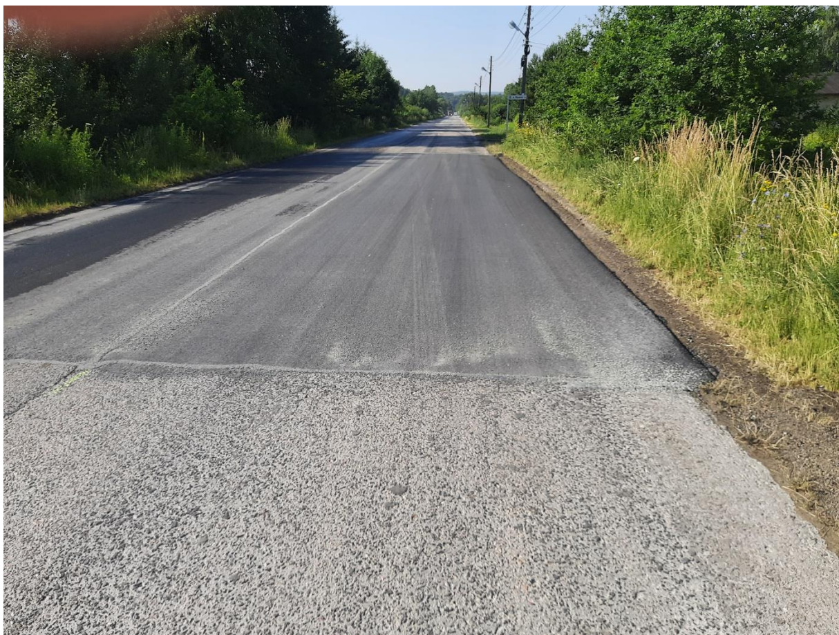
ul. Wapienna w Koninie