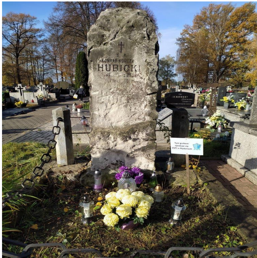
Mogiła Konrada Korczaka Hubackiego