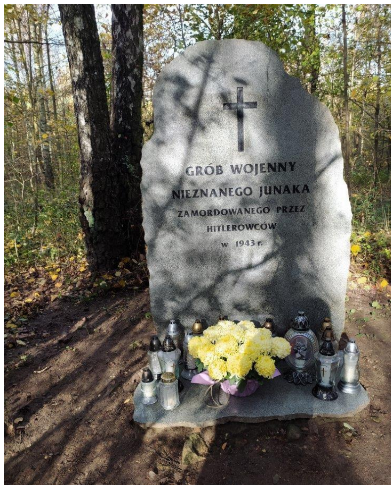
Mogiła wojenna nieznanego junaka