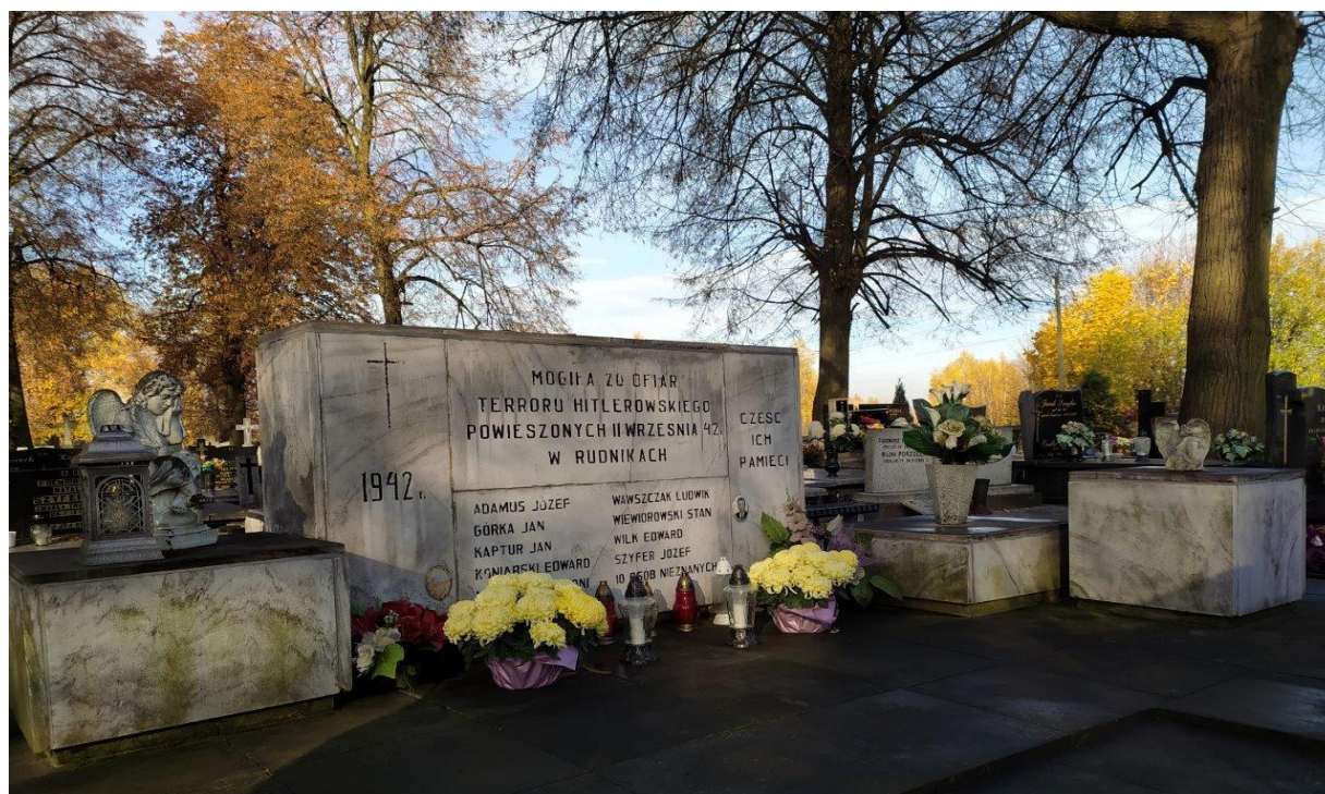
Mogiła 20 ofiar terroru hitlerowskiego powieszonych 11 września 1942r.